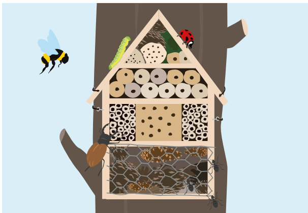
Et insekthotel tiltrækker insekter til din have.

Vil du gøre noget mere ud af at tiltrække flere insekter til din have, kan du bygge et insekthotel. Det er en konstruktion med mange hulrum og gemmesteder, hvor insekter kan skjule sig for rovdyr og finde ly for vinteren. Har du ikke mulighed for selv at lave et insekthotel, kan man købe mindre, færdige udgaver hos forskellige forhandlere.