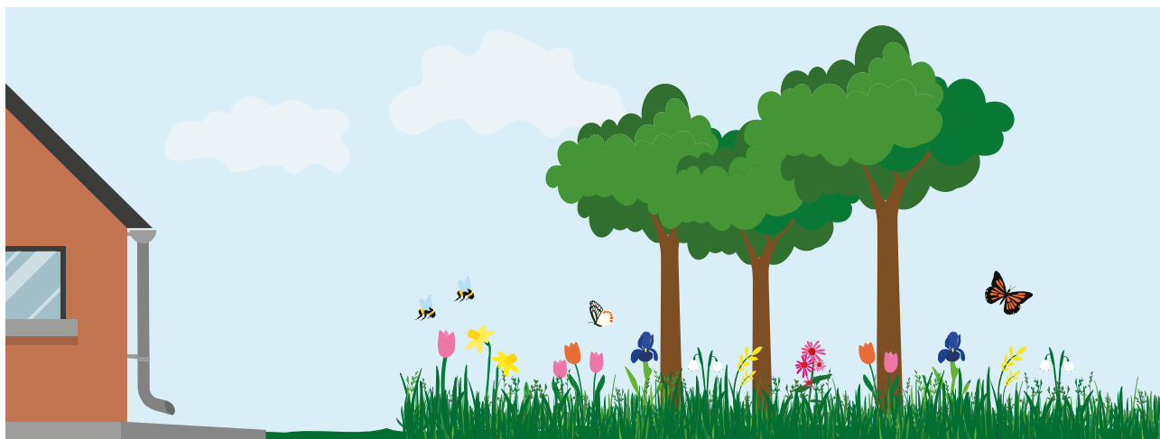
En have med et varieret udvalg af blomster giver føde til bier og andre insekter.

Det er i det hele taget en god idé, at hele haven er dækket af planter i stedet for bar jord. Det giver plads og gode levesteder til insekter. Og er der mange insekter, får din have også besøg af flere fugle. De spiser store mængder af de insekter, du helst er fri for i for eksempel køkkenhaven.