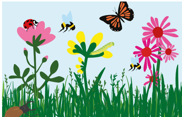
Undgå sprøjtemidler, hvis du vil have mere liv i haven.

Selv om nogle insekter kan være irriterende, er de føde for dyr længere oppe i fødekæden. Og er der ikke føde nok i din have, vil fugle og padder finde et andet sted at være. Så drop sprøjtegiften, hvis du vil have mere liv i din have.