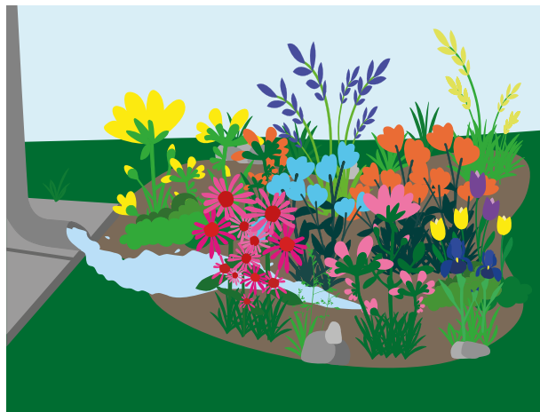
Et regnbed udnytter det gratis regnvand og giver liv i haven.

Det gratis regnvand kan du også bruge i et regnbed, hvor forskellige planter er med til at give mere liv i haven.